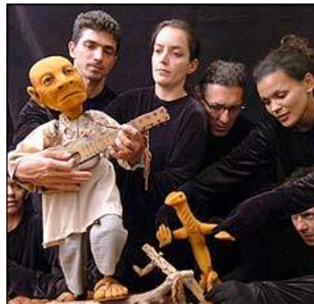
A Zero Cia. de Bonecos, de Belo Horizonte, apresenta Sevé